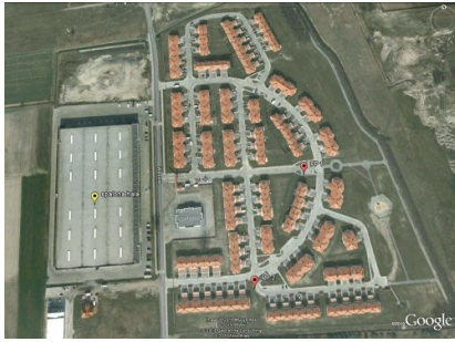
Lokalizacja punktów pomiarowych

W dniu dzisiejszym 27 maja 2011 r. prowadzone będą dalsze pomiary w celu potwierdzenia bądź wykluczenia występowania podwyższonych stężeń.