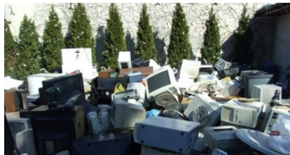
Zbiórka odpadów na terenie Szkół Salezjańskich w Mińsku Mazowieckim w dniach 22 i 23 marca 2013r.

wymagało zadanie polegające na zorganizowaniu zbiórki zużytego sprzętu elektrycznego i elektronicznego na terenie szkoły.