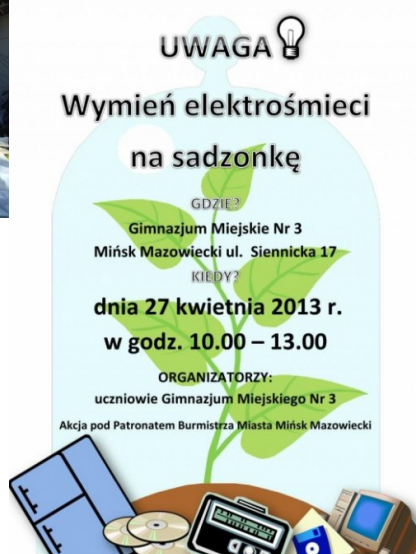
Zbiórka w Gimnazjum Miejskim Nr 3 w Mińsku Mazowieckim w dniu 27 kwietnia 2013r. (1)