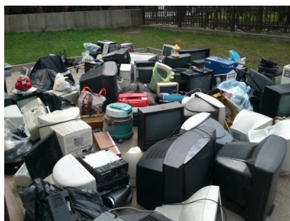
Zbiórka w Gimnazjum Miejskim Nr 3 w Mińsku Mazowieckim w dniu 27 kwietnia 2013r. (3)