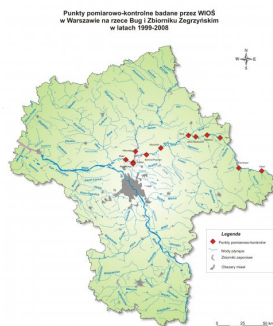
Lokalizacja przekrojów pomiarowo-kontrolnych badanych przez WIOŚ w Warszawie na rzece Bug i Zbiorniku Zegrzyńskim w latach 1999-2008