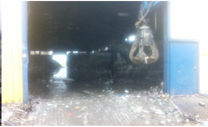
Kobierniki - pożar odpadów