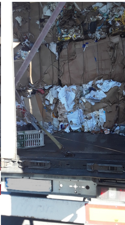
Kontrola drogowa pojazdów przewożących odpady przy drodze krajowej nr 60