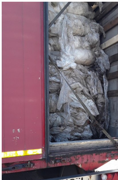
Kontrola drogowa pojazdów przewożących odpady przy drodze krajowej nr 60