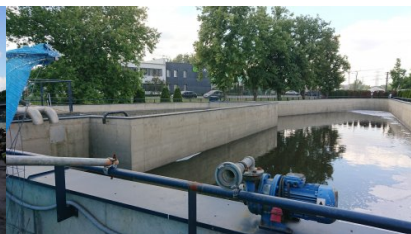
zbiornik retencyjny wód opadowych i ścieków pożarniczych