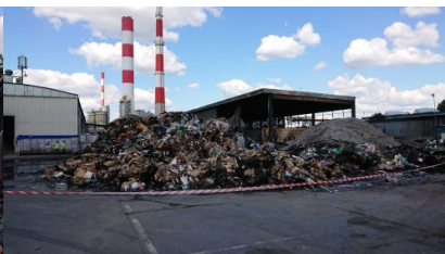
widok na wiatę objętą pożarem oraz spalone odpady