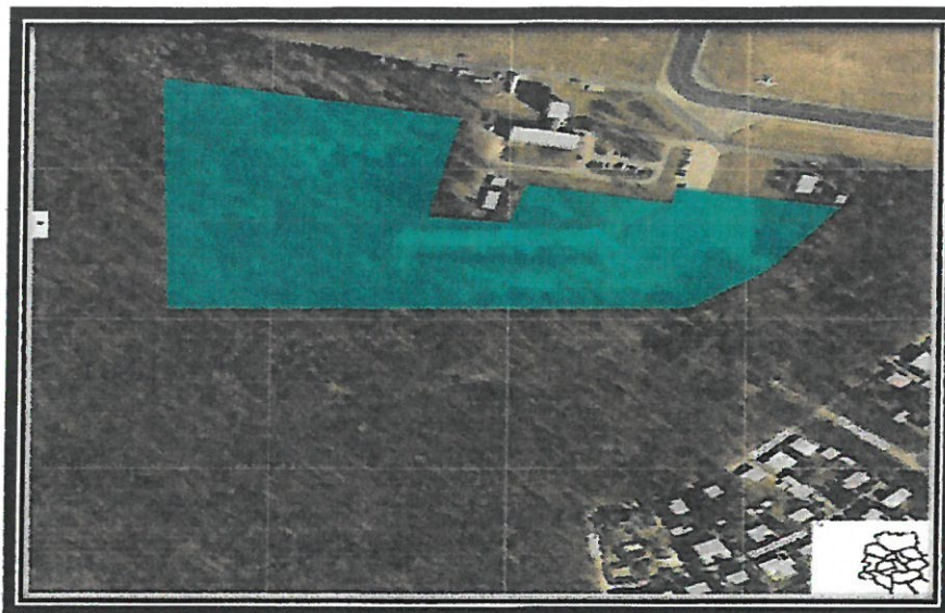
Ryc.1. Zdjęcie satelitarne działki nr 8, z obrębu 61001 o powierzchni 5ha

drzewami i krzewami oraz runem leśnym lub przejściowo jej pozbawiony przeznaczony do produkcji leśnej”.