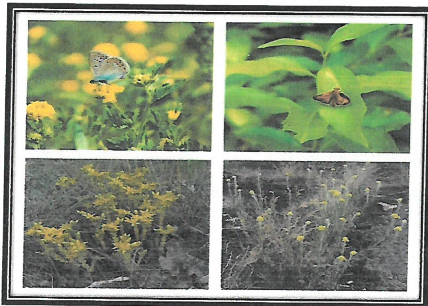
Ryc.3. Stanowiska roślin łąkowych, w tym miododajnych przy lotnisku i wewnątrz strzelnicy chętnie odwiedzanych przez owady zapylające, m.in. motyle. Na glebach piaszczystych dominują rozchodniki ostre ( Sedum acre ) i kocanki piaskowe ( Helichrysum arenarium ) (oryg.)