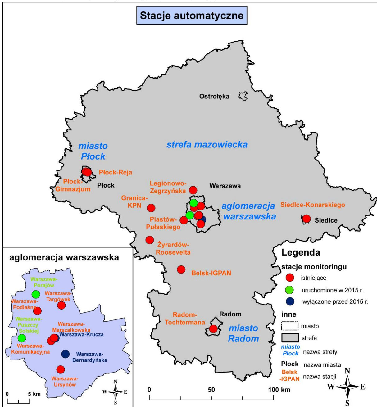
Mapa nr 2.1.1. Lokalizacja stacji automatycznych istniejących w województwie mazowieckim

Mapę nr 2.1.1. Lokalizacja stacji automatycznych istniejących w województwie mazowieckim (str. 15) należy zastąpić poniższą mapą: