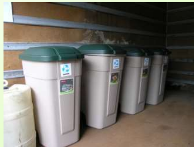
PSZOK Gminy Sterdyń