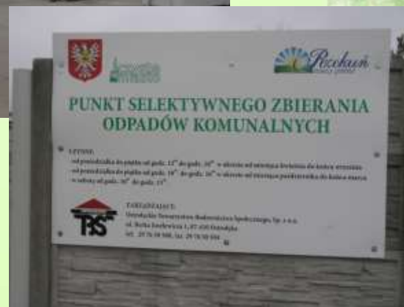
PSZOK w Gminie Czerwonka